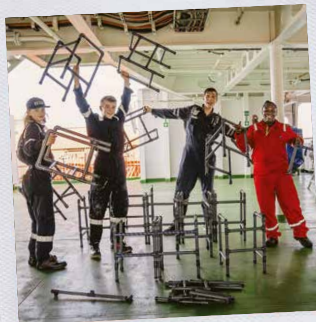
Fabrication de déambulateurs par les élèves du Global Mercy

Trois d'entre eux ont mis la main à la pâte et fabriqué des déambulateurs pour nos jeunes patients opérés de malformations orthopédiques. Une incroyable source de motivation !